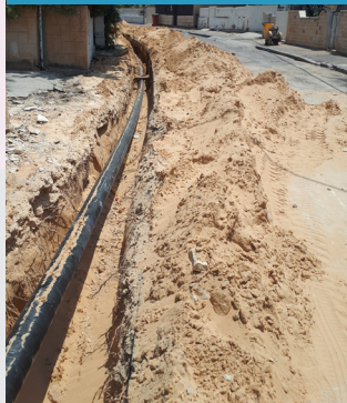
שדרוג קווי מים רח' הנגב