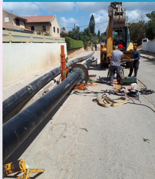
ניפוץ קווי ביוב רח' גולדה מאיר